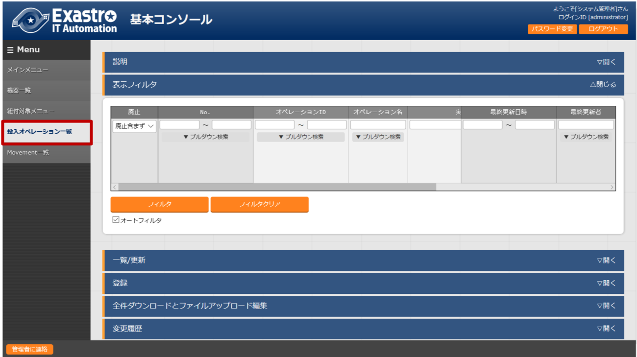
図 4-6 サブメニュー画面(投入オペレーション一覧)