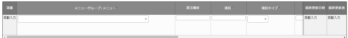
図 4-13 ER 図項目管理

(2) 「登録」-「登録開始」ボタンより、ER 図に表示するメニュー情報の登録を行います。