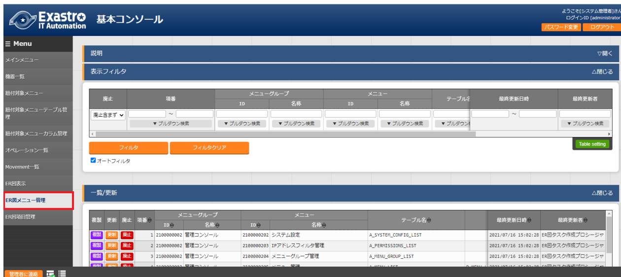
図 4-10 サブメニュー画面 (ER 図メニュー管理)

インストール時『ER 図メニュー管理』メニューは非表示の設定になっております。管理コンソールのロール・メニュー紐付管理メニューにて復活処理を行うことによって表示されるようになります。