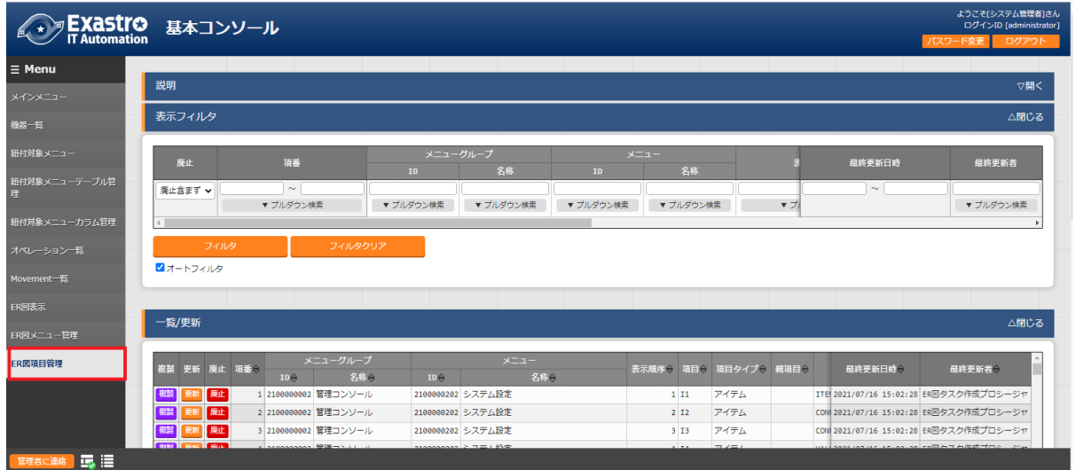
図 4-12 サブメニュー画面(ER 図項目管理)

インストール時『ER 図項目管理』メニューは非表示の設定になっております。管理コンソールのロールメニュー紐付管理メニューにて復活処理を行うことによって表示されるようになります。