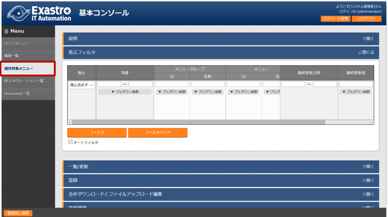
図 4-4 サブメニュー画面(紐付対象メニュー)

BackYard で自動的に作成されますが、手動で変更したい場合は本メニューをメンテナンスしてください。インストール時『紐付対象メニュー』は非表示の設定になっております。管理コンソールのロール・メニュー紐付管理メニューにて復活処理を行うことによって表示されるようになります。