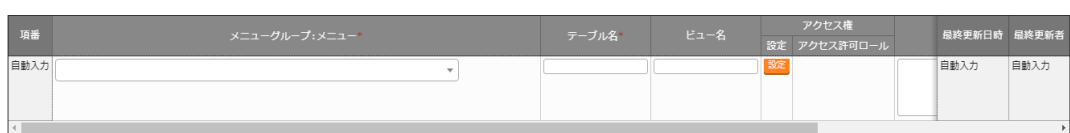
図 4-11 ER 図メニュー管理