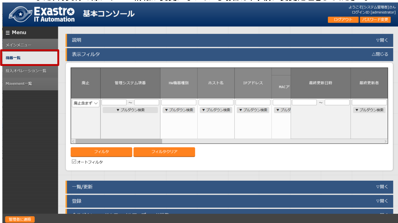
図 4-1 サブメニュー画面(機器一覧)